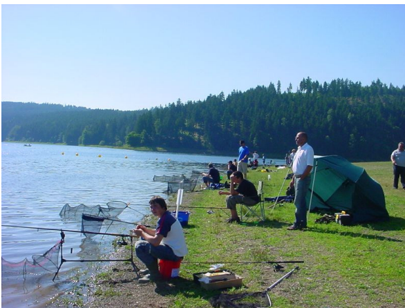
Natürlich kam das Angeln an beiden Tagen nicht zu kurz