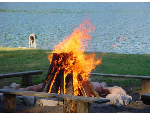
Traditionell klang auch in diesem Jahr der ereignisreiche Tag mit einem Lagerfeuer aus, an dem sich jeder seine Wurst selbst grillen konnte